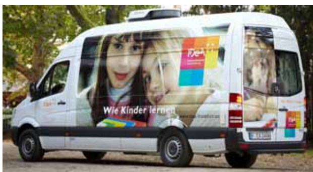
Im Sommer 2009 wurde die Ausstattung des IDeA-Zentrums um ein mobiles Testlabor ergänzt.