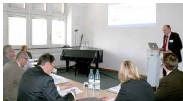
Erfolgreiche Evaluation in 2011