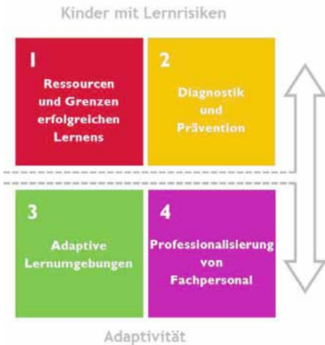
Die vier Programmbereiche des IDeA-Zentrums im LOEWE-Förderzeitraum

Einen ganz anderen Fokus auf Adaptive Lernumgebungen nahm das Projekt ULe (Urbane Lernräume) ein. Es untersuchte das Frankfurter Bahnhofsviertel als außerschulischen Lernraum von Kindern im Grundschulalter. Entstanden sind umfangreiche Erkenntnisse über den Alltag von Grundschulkindern im Bahnhofsviertel, ihre Perspektiven auf das Viertel als Lebens- und Lernraum und ihre Deutungen und Sinnzusammenhänge. Mit dieser qualitativen Längsschnittstudie leistet ULe einen Beitrag zur Analyse individueller Perspektiven und Entwicklungen von Kindern und ihren Familien in der Großstadt.