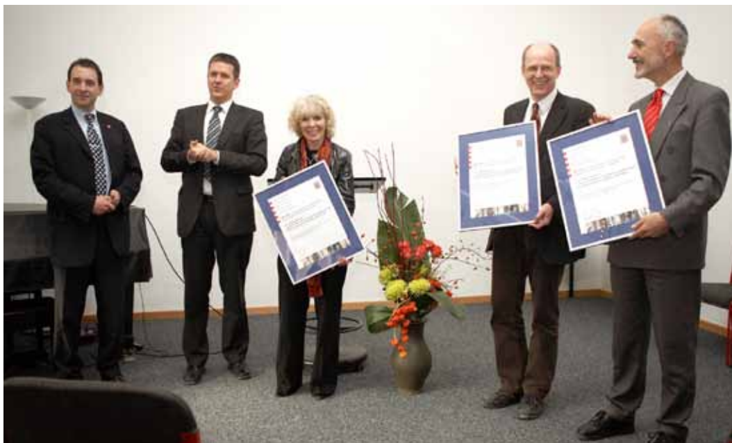
Auftaktveranstaltung zur Gründung des IDeA-Zentrums im Oktober 2008